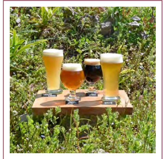
テイスティングセット